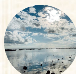
秋田のウユニ塩湖は家族連れにも人気!