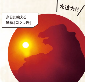
夕日に映える通称「ゴジラ岩」