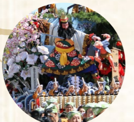
盛岡は勇壮で華やかな秋まつりも開催